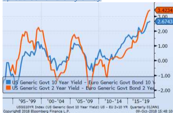
Spread US vs Euro 2y e 10y

Lo spread tra le curve US ed EUR continua ad espandersi sulla parte a 2 anni oltrepassando il 3% mentre si è riportato al 2,5% sulla parte a 10 anni