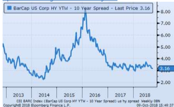
Spread US High Yield vs 10y US

Dopo l'allargamento subito nella prima parte del 2017, lo spread HY si è stabilizzato. Rimane comunque su livelli storicamente contenuti.