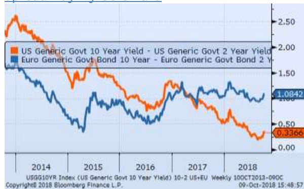
Spread 10y-2y US e Euro

Il movimento di flattening sembra essersi interrotto sulla curva US, mentre è stabile su quella Eur